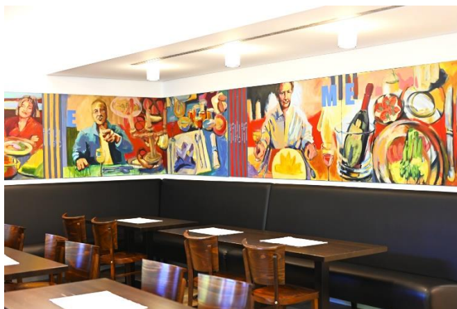
Iris Wöhr-Reinheimer, Remember Me, Speisesaal Tagungszentrum Hohenheim

viele Teilnehmerinnen und Teilnehmer interessieren, können in den übersichtlichen Räumlichkeiten besprochen werden. Seien Sie dabei, diskutieren Sie mit!