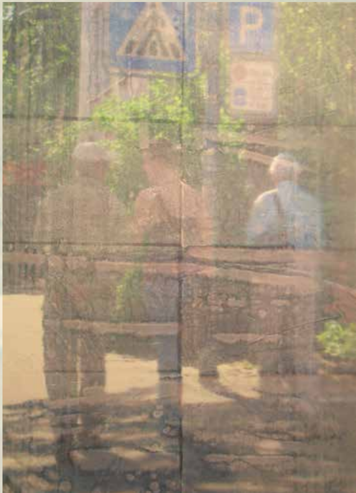
»Jagdszenen M3«, 2007, Pigmentdrucktransfer, 115 x 80 cm