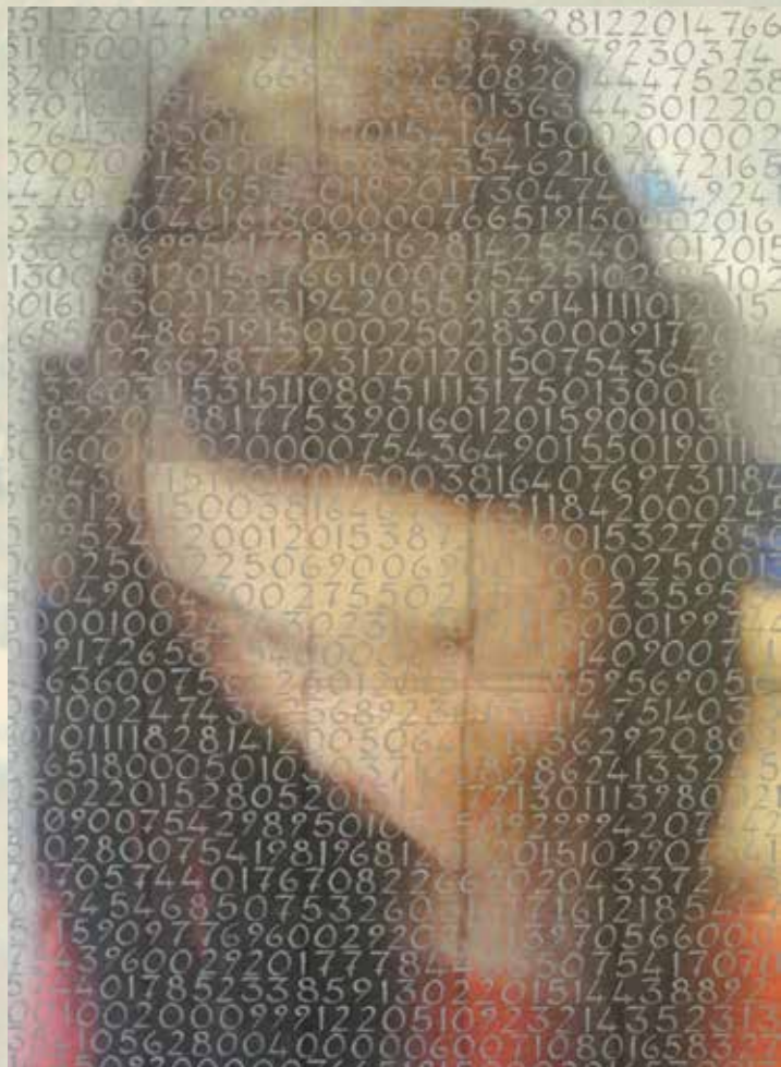
»Numberdiary 25.12.2014-12.02.2015«, 2018, Pigmentdrucktransfer, 190 x 140 cm