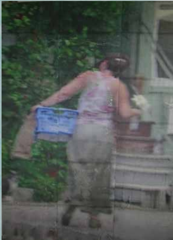
Abb. oben: »Fallenbachbilder 9«, 2009, Pigmentdrucktransfer, 160 x 115 cm Abb. rechts: »Fallenbachbilder 10«, 2009, Pigmentdrucktransfer, 160 x 115 cm