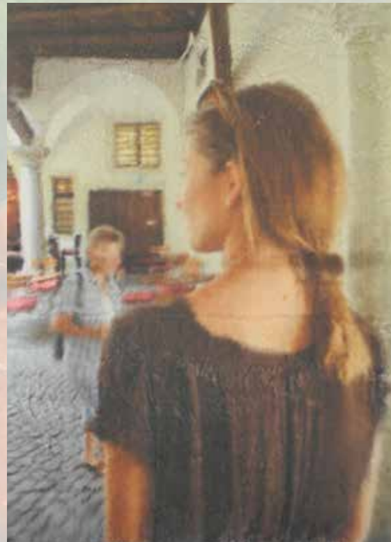
»Leonie 8«, 2013, Pigmentdrucktransfer, 55 x 40 cm