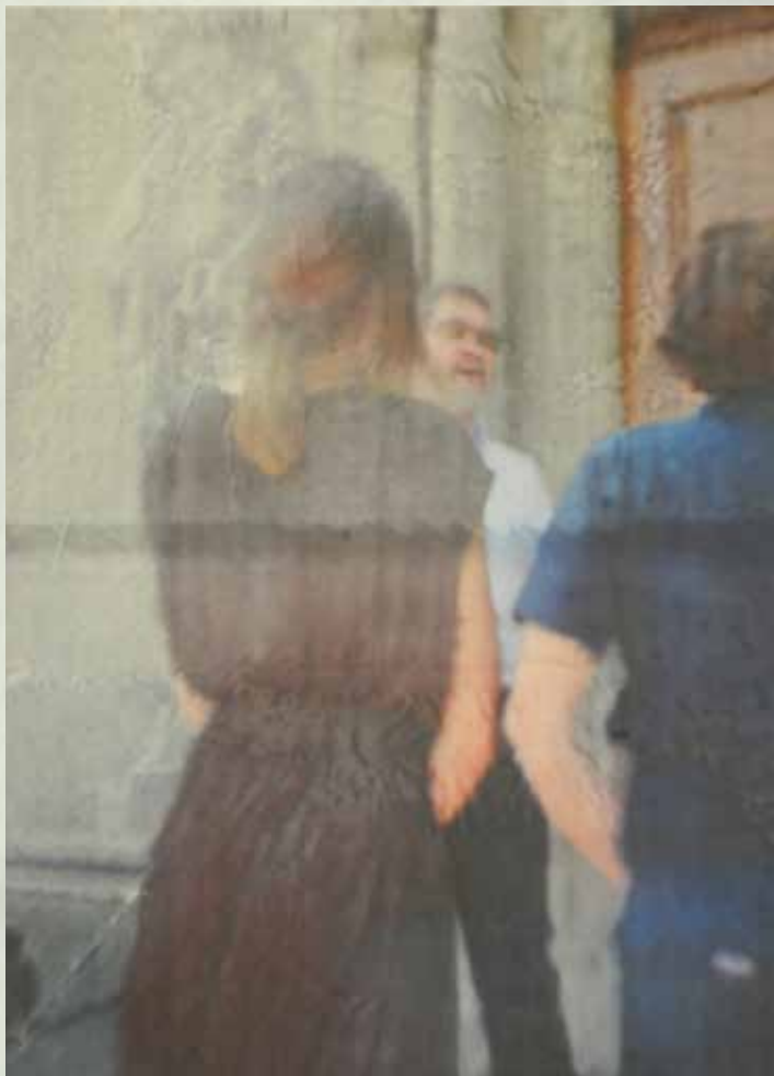
»Leonie 9«, 2013, Pigmentdrucktransfer, 55 x 40 cm