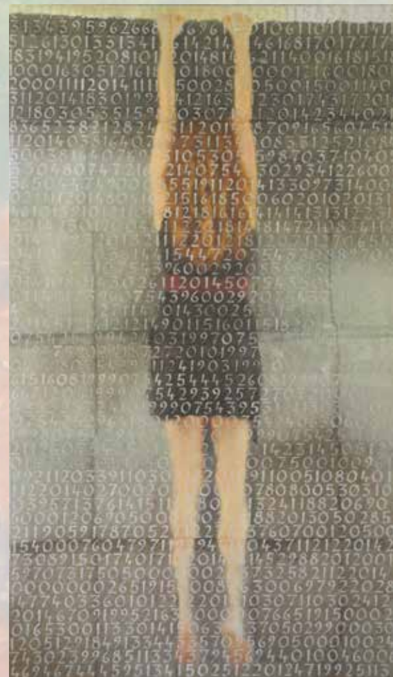
»Numberdiary 9.11.2014-5.12.2014«, 2015, Pigmentdrucktransfer, 242 x 140 cm